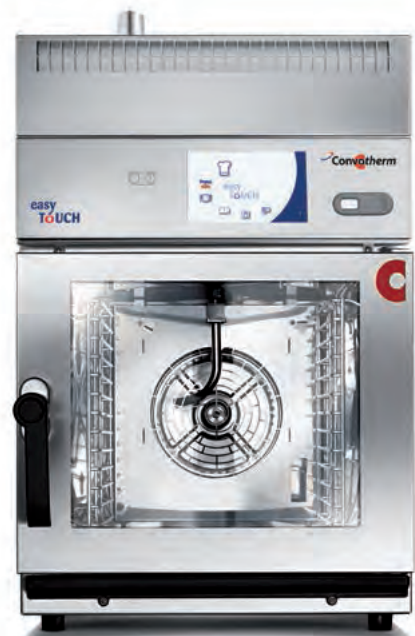
ConvoVent mini afzuigkap; ideaal voor frontcooking.