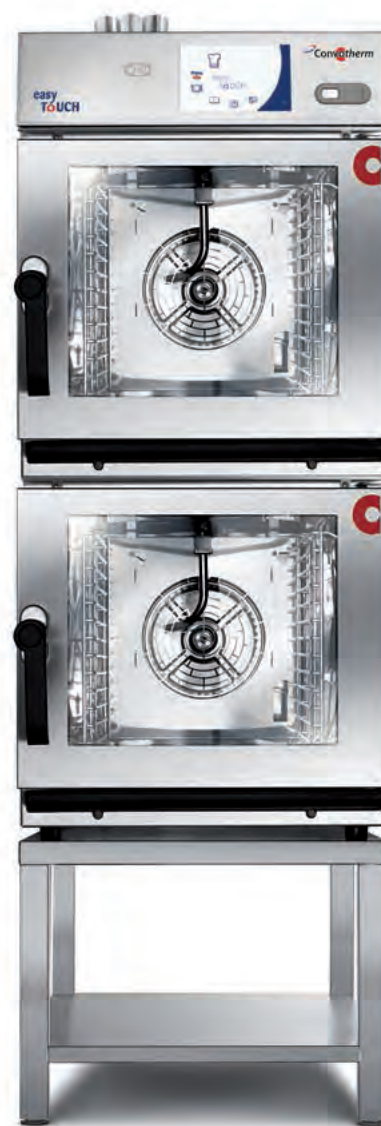
6.10 mini 2in1* (2 x 6 x 1/1 GN)

Onze robuuste apparaten met een ongekend lange levensduur beschikken over alle functies die u vandaag de dag in de keuken nodig hebt: