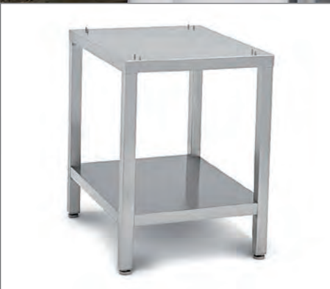
Onderstellen geschikt voor elke mini