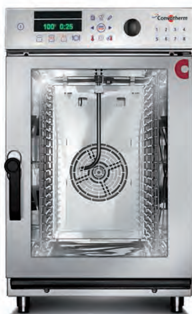
10.10 mini (10 x 1/1 GN)