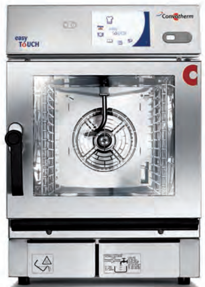
6.06 mini mobil 6 x 2/3 GN 6.10 mini mobil 6 x 1/1 GN