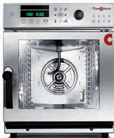
6.06 mini (6 x 2/3 GN) – ook mobiel 6.10 mini (6 x 1/1 GN) – ook mobiel

Tot onze mini-serie behoren combi-steamers in vier verschillende maten: