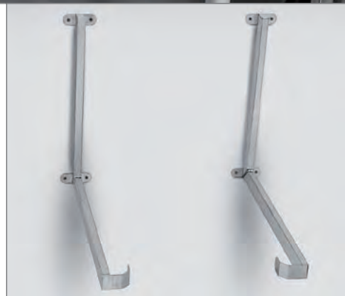
Wandbevestiging voor een stevige montage boven werkoppervlakken